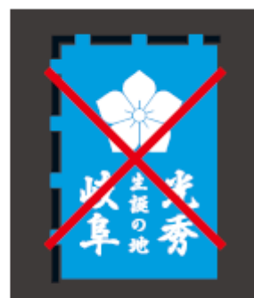
不明瞭な表示をしてはいけない