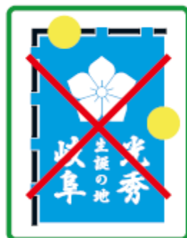
周囲にデザインを損ねるような図形を配置してはいけない