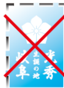
グラデーションを使用しない