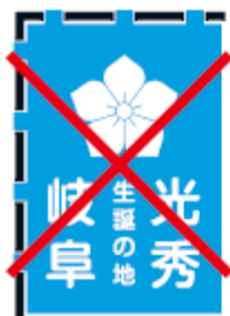
書体を変えてはいけない