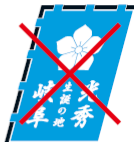
変形してはいけない