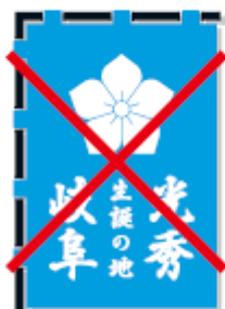
陰影をつけてはいけない