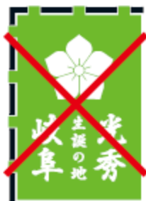
指定色以外の色、イメージを著しく損なう色を使用しない