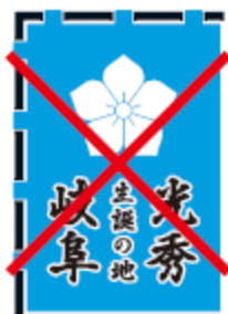
書体にフチをつけてはいけない