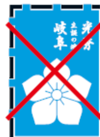
バランスを変えてはいけない